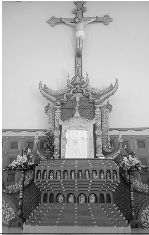
မြန်မာ အနုပညာလက်ရာဖြင့် အလှဆင်ထားသော ညောင်လေးပင်မြို့ လုဒ်မယ်တော် ဘုရားကျောင်း

“အမြင် စုတ်သော်လည်း ရွှေထုပ် သည့် မြပုဝါ” ဟုမြန်မာ့အဆိုအမိန့်ရှိပါသည်။ ဆိုလိုသည်မှာ အမြင်မတင့်တယ်သော်လည်း အဖိုးထိုက်သောအရာကို လုံခြုံအောင်၊ မပွန်း မပဲ့အောင် ထိန်းသိမ်းပေး၊ ဖုံးအုပ်ထားပေး သည်ဟု ဆိုလိုပါသည်။ ရှေးခေတ်၌ အဖိုးတန် ရတနာများကို အဖိုးတန်သော ပိတ်စများဖြင့် ဖုံးအုပ်သို့ဝက်ထားပါက သူရိုး၊ ဓားပြတို့၏ ရန် ကို ကြောက်ရသောကြောင့် လူအထင်မကြီး လောက်သော၊ လူသတိမထားမိလောက်သော ဟောင်းနွမ်းနေသည့် ပိတ်စများ ဖြင့်ဖုံးအုပ် ထုပ်ပိုးထားတတ်လေ့ရှိပါသည်။ ဤအဆိုသည် မှန်သင့်သလောက်မှန်သော်လည်း ဖြစ်သင့် သည်မှာ တော်ဝင်သူတစ်ဦးအနေဖြင့် ထမင်း ဆီဆန်းစား၍ ရွှေလင်ပန်းနှင့် အချင်းဆေးလျှင် ပို၍အပ်စပ်ပေမည်။