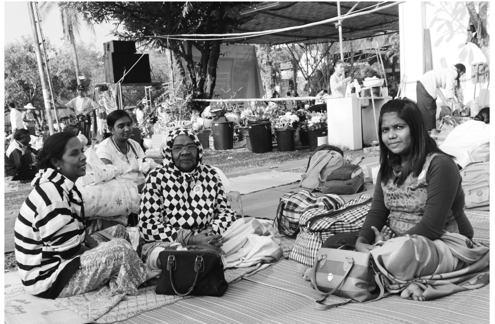
ရန်ကုန် စိန်မေရီမှ ဖီလိုမီးနား မိသားစု

ရွာကနေဒီကို တနေကုန်ကားစီးရတယ်။ အားလုံး ၁၇ ယောက်၊ ကားတစ်စီးစာ ပေါ့လေ။ ကားကတော့ တနေကုန်စီးရတယ်။ မနက်မိုးလင်းက ထွက်လာတာ ည ၈ နာရီမှ ဒီကို ရောက်တယ်။ ကျမတို့က ချင်းလူမျိုးတွေပေါ့။ ရွာမှာကတော့ ဘာသာသုံးမျိုးရှိတယ်။ ဗုဒ္ဓဘာသာ၊ နှစ်ခြင်းနဲ့ ကက်သလစ်တွေ။ ဒီကို လာရတာ စိတ်ဝင်စားပါတယ်။ မယ် တော်ဆီကို ဆုတောင်းဖို့၊ ဖူးဖို့လာတာပေါ့။ ကျန်းမာဖို့၊ တိုင်းပြည် ငြိမ်းချမ်းဖို့၊ အိပ်ဆောင် မရှိတော့ဘဲ ဒီကွင်းထဲမှာပဲ ဒီလိုနေရတာ ရပါတယ်။ ဘာမှ မဖြစ်ပါဘူး။ အဆင်ပြေပါတယ်။