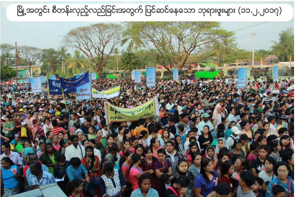
မြို့အတွင်း စီတန်းလှည့်လည်ခြင်းအတွက် ပြင်ဆင်နေသော ဘုရားဖူးများ (၁၁.၂.၂၀၁၇)