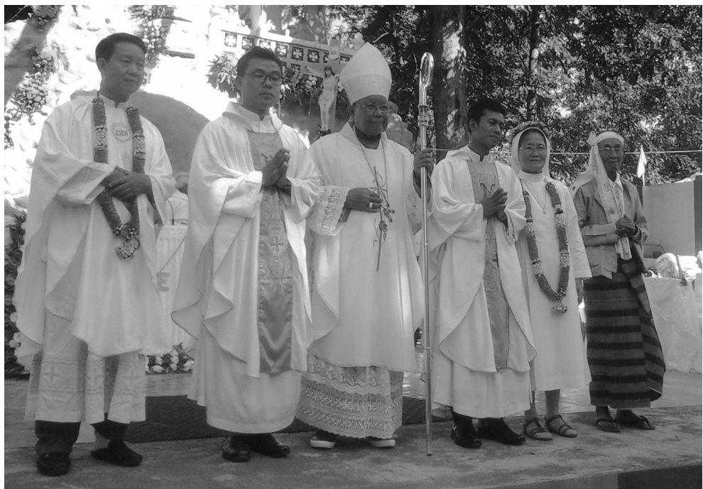
ဆရာတော်ဘုရား၊ ရဟန်းသစ် ၂၅ ဦးနှင့် ဂျူဘီလီရှင်များ