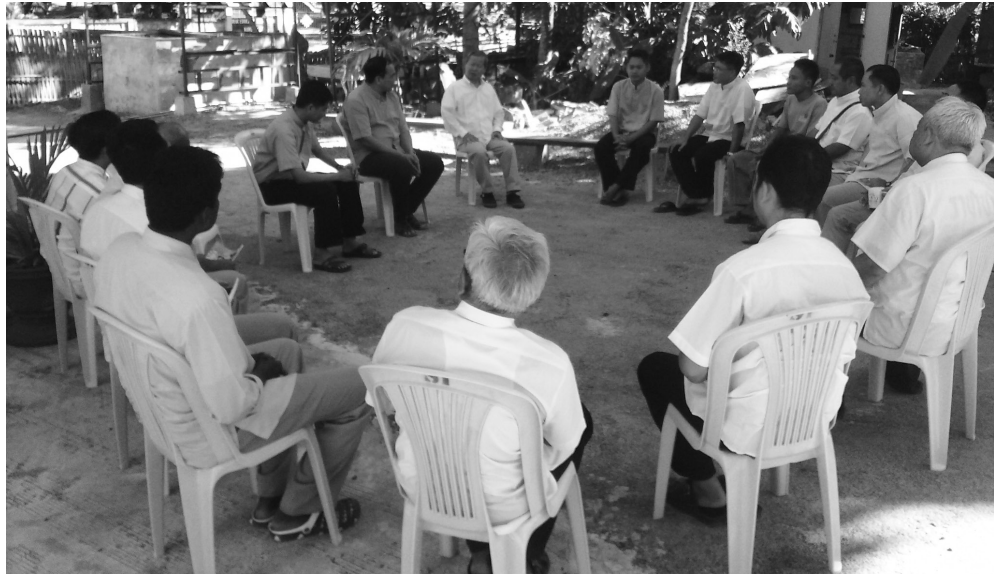
မော်လမြိုင်၊ ၉.၂.၂၀၁၇

မော်လမြိုင် ကက်သလစ် ဂိုဏ်းအုပ် သာသနာ ဘုန်းတော်ကြီးများ နှစ်ပတ်လည် ဝတ်စောင့်ပွဲမတိုင်ခင် ၅ ရက်တာ Diocesan