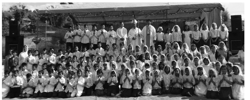
ဆရာတော် အိုက်ဇက်ခါနုအား ခရစ္စမားအားပေးခြင်းခံယူသော သားသမီးများနှင့်အတူတွေ့ရစဉ်

တောင်ငူသာသနာ ဂိုဏ်းအုပ်ဆရာတော် အိုက်ဇက်ခါနု၏ နယ်လှည့်ခရီးစဉ်ကို (၁၆.၁.၂၀၁၇ မှ ၂၅.၁.၂၀၁၇) အထိ တောင်ငူသာသနာ၊ လေဒူခေါင်တိုက်နယ်၊ သိကျိုတ်တိုက်နယ် နှင့် ဘီစီကုန်းတိုက်နယ် တို့သွားရောက်ကာ ကလေး သူငယ်များ ခရစ္စမားအား ပေးခြင်း စက္ကရမင်းတူးပေးခြင်းနှင့် ဘာသာသူများ အားတွေ့ဆုံ အားပေးခဲ့ပါသည်။ သိ