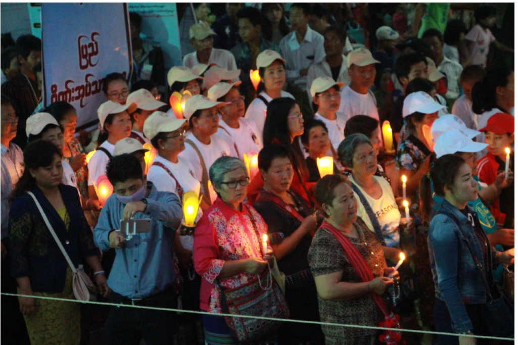
မြို့အတွင်း စီတန်းလှည့်လည်ခြင်းတွင် မြင်ရသော ကျိုင်းတုံသာသနာမှ ဘုရားဖူးများ