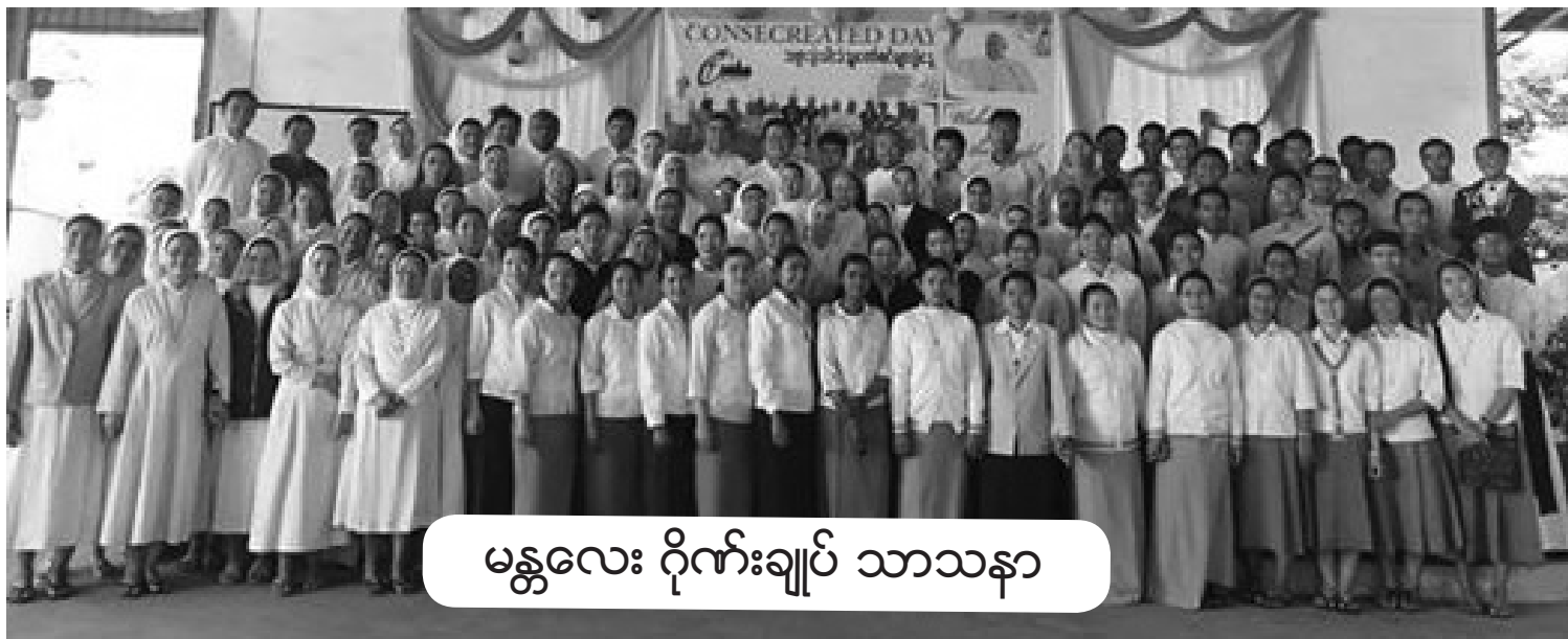
မန္တလေး ဂိုဏ်းချုပ် သာသနာ