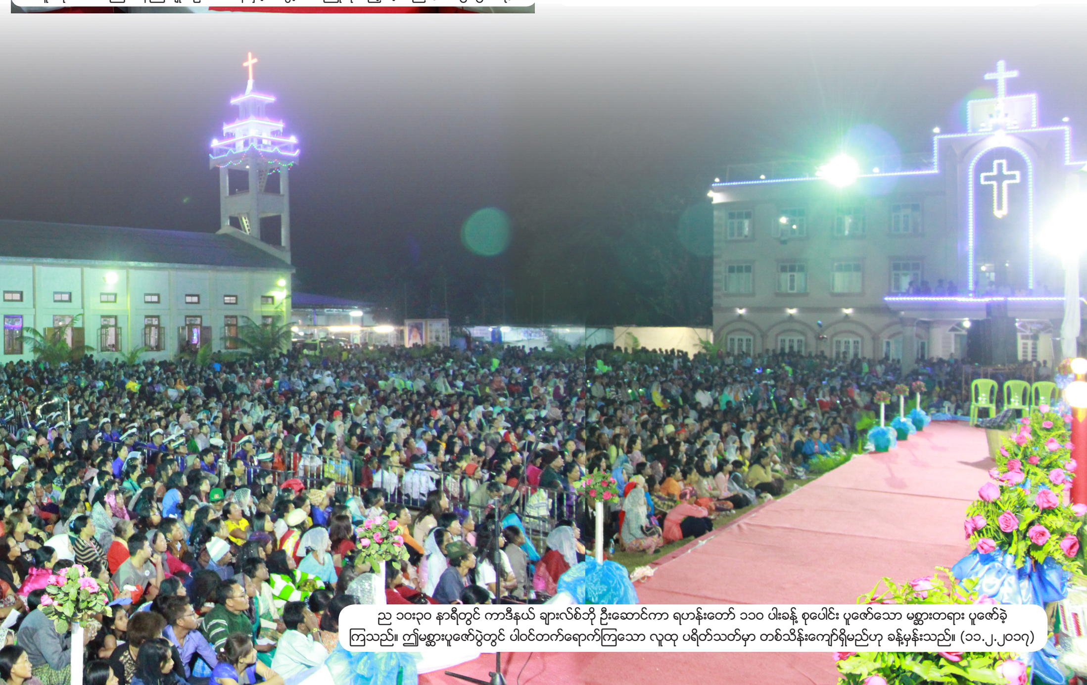
ည ၁၀:၃၀ နာရီတွင် ကာဒီနယ် ချားလ်စ်ဘို ဦးဆောင်ကာ ရဟန်းတော် ၁၁၀ ပါးခန့် စုပေါင်း ပူဇော်သော မစ္စားတရား ပူဇော်ခဲ့ကြသည်။ ဤမစ္စားပူဇော်ပွဲတွင် ပါဝင်တက်ရောက်ကြသော လူထု ပရိတ်သတ်မှာ တစ်သိန်းကျော်ရှိမည်ဟု ခန့်မှန်းသည်။ (၁၁.၂.၂၀၁၇)