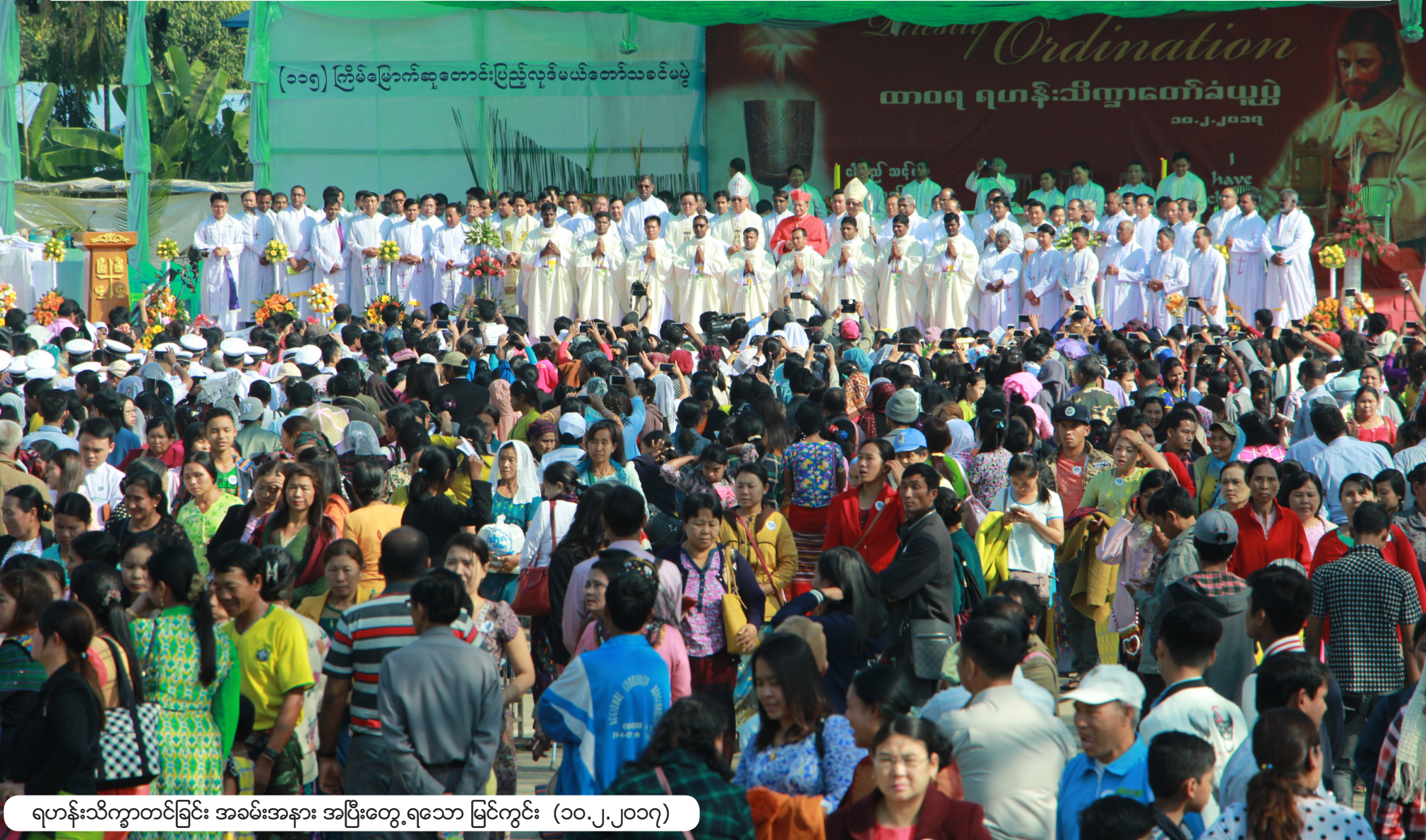
(၁၀၅) ကြိမ်မြောက်ဆုတောင်းပြည့်လုဒ်မယ်တော်သခင်မပွဲ

100th Anniversary Ordination ထာဝရ ရဟန်းသိက္ခာတော်ခံယူပွဲ ၁၀.၂.၂၀၁၇