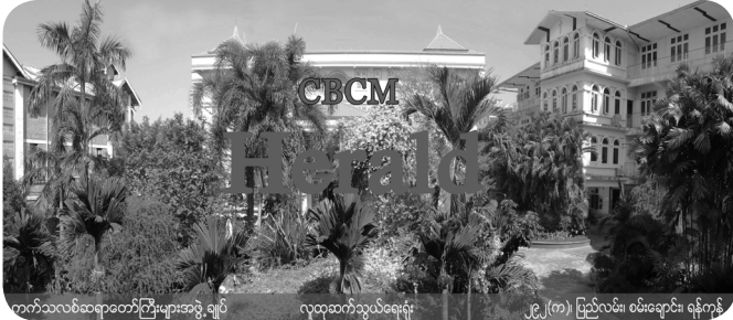
ကက်သလစ်ဆရာတော်ကြီးများအဖွဲ့ချုပ် လူထုဆက်သွယ်ရေးရုံး