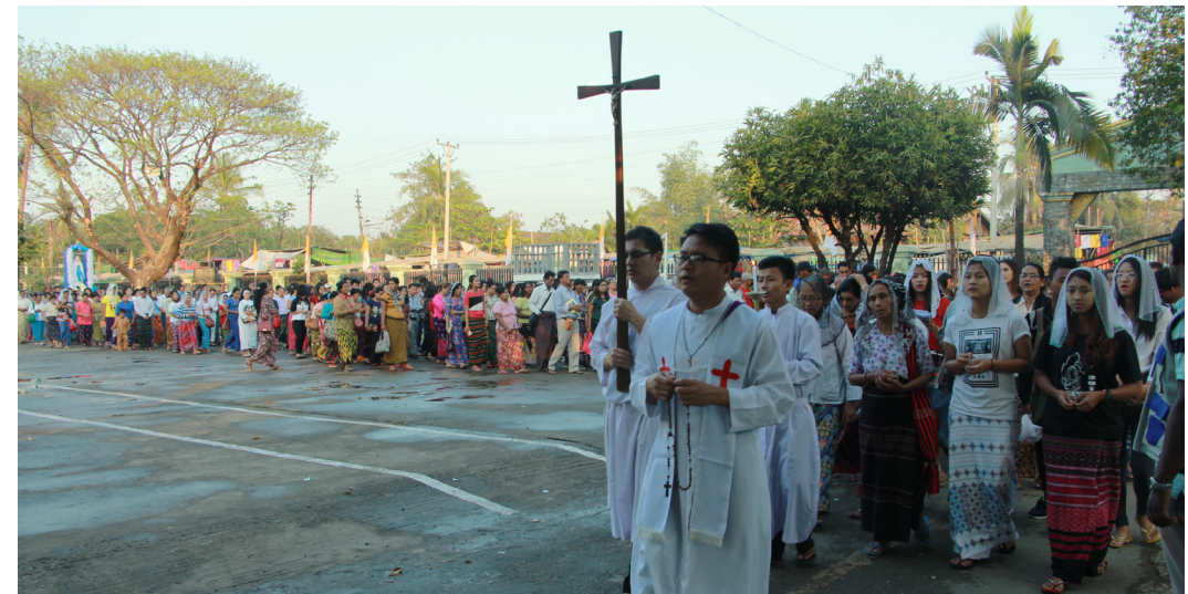
နိုဗီနာ ရက်များအတွင်း ညနေ ၄ နာရီ မစ္စားတရားပြီးတိုင်း ကျောင်းဝင်းအတွင်း စီတန်းလှည့်လည်ခြင်းပြုလုပ်သည်