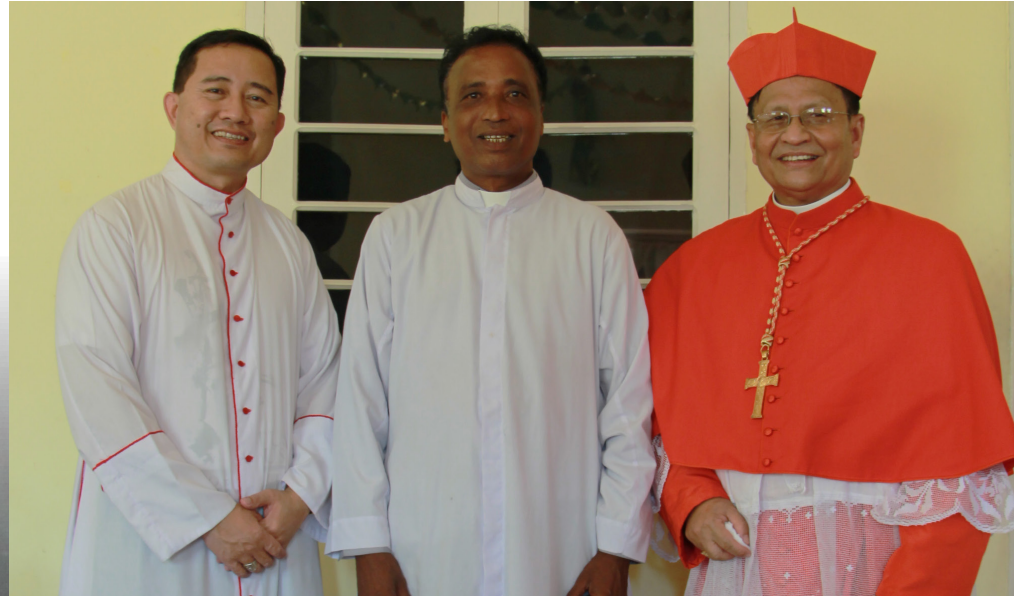
ညောင်လေးပင် ကျောင်းထိုင်ဘုန်းတော်ကြီး ဖါသာရီဂျွန် အား ကာဒီနယ် ချားလ်စ်ဘို ဆရာတော် ဂျွန်စောယောဟန်တို့နှင့်အတူ တွေ့ရစဉ်