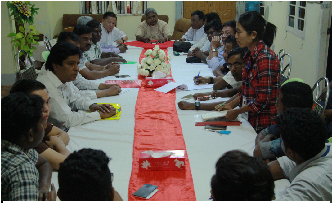
အလွန် အလုပ်လုပ်သော ပွဲတော်ကျင်းပရေး ကော်မတီ အစည်းအဝေး