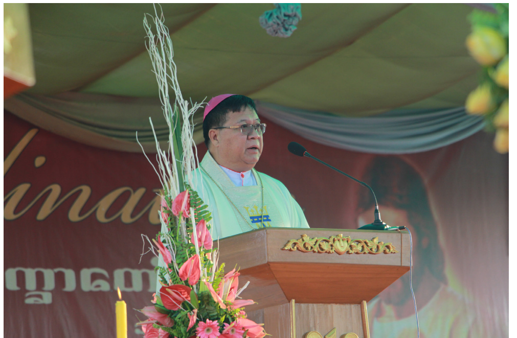
တောင်ကြီးသာသနာ ဂိုဏ်းချုပ်ဆရာတော်ကြီး ဘာစီလီအို အားသိုက်သည် ဖေဖော်ဝါရီလ ၁၀ ရက်နေ့ ညောင်လေးပင်တွင် ရဟန်းသိက္ခာတင်ခြင်း မစ္စားတွင် ဩဝါဒ ပေးခဲ့သည်။