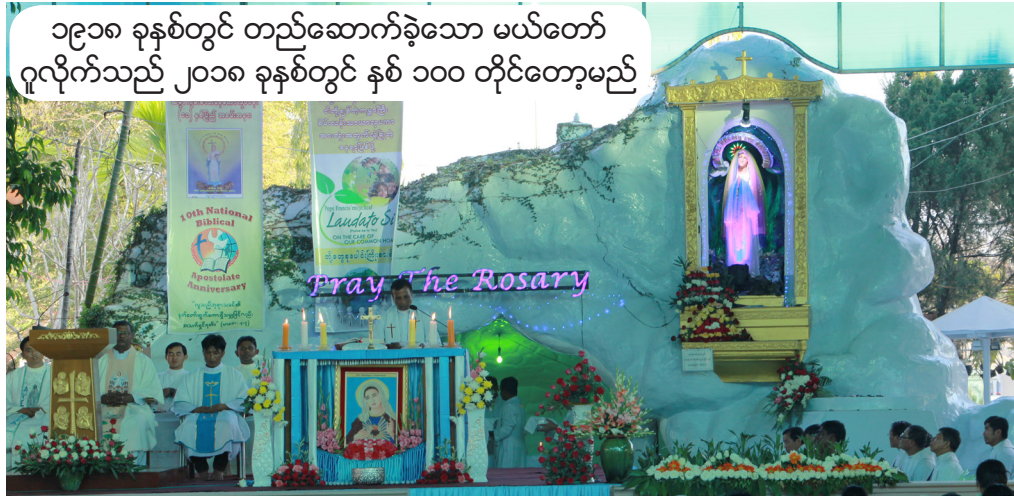
၁၉၁၈ ခုနှစ်တွင် တည်ဆောက်ခဲ့သော မယ်တော် ဂူလိုက်သည် ၂၀၁၈ ခုနှစ်တွင် နှစ် ၁၀၀ တိုင်တော့မည်