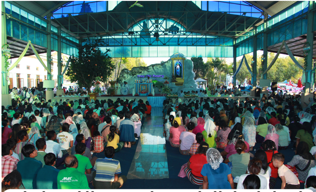
မယ်တော် ဂူရှေ့တွင် နိုဗီနာ မစ္စားတရားကို ညနေ ၄ နာရီအချိန်တွင် နေ့စဉ်ကျင်းပသည်

နိုဗီနာ ရက်များအတွင်း ဖေဖော်ဝါရီလ ၇ ရက် နေ့တွင် သမ္မာကျမ်းစာ တမန်တော် လုပ်ငန်း ၁၀ နှစ်ပြည့် အထိမ်းအမှတ်နှင့် သမ္မာကျမ်းစာ အသိပညာပြိုင်ပွဲကျင်းခဲ့သည်။ ၁၀ ရက် နေ့တွင် ရဟန်း ကိုးပါးတို့၏ သိက္ခာတင်မင်္ဂလာ အခမ်းအနားကိုလည်း ကျင်းပပြုလုပ်ခဲ့သည်။